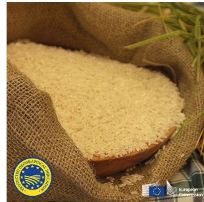
Nagykun rizs OFJ

Az uniós élelmiszer- és italágazat exportjának 15,4%-a