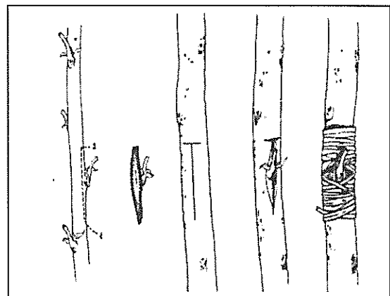
2. ábra: A szemzés menete: a szemző-hajtásról a szem levágása után az alanyon T-vágást ejtünk, majd a szemet behelyezzük az alany héja alá és bekötözzük.